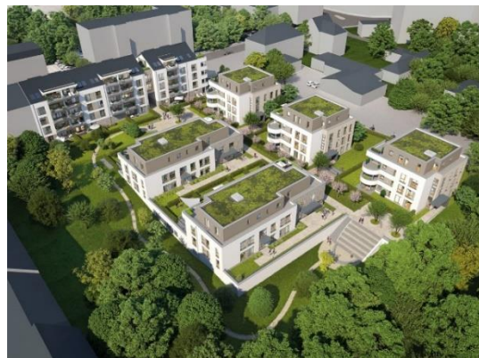
Abbildung 1: Neubau Wohnquartier BelleRü, Essen, Interboden GmbH & Co. KG, 2020